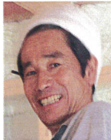
棟梁の神戸です。 腕はピカイチ(^^)/ 自慢の仕事を見に来て 下さい!!