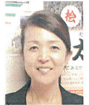
インテリアコーディネーター カラーコーディネーター 住宅ローンアドバイザー 職員 暢子より

昔の人たちは月明かりを頼りに暮らしていたんですよ…いかに月が出るのを待ち望んでいたか。なにかとても感慨深い気持ちにさせられますね(´▽`)