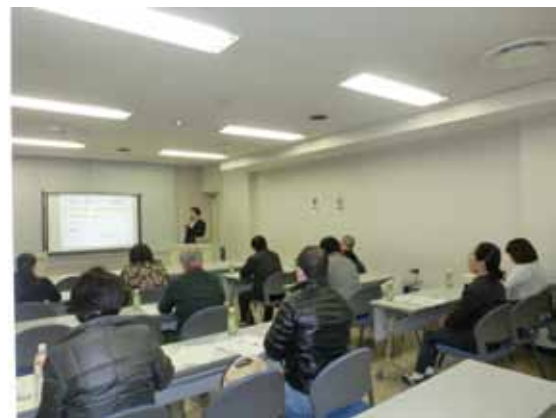
「家づくり無料勉強会」の様子

マスコミも注目している無料勉強会を是非、お役立て下さい。お申し込みは 今すぐ 。