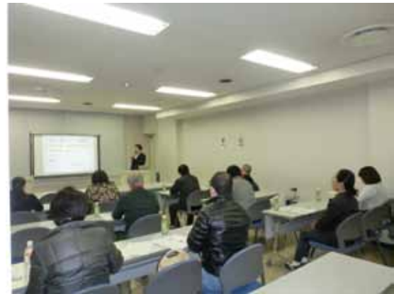
「家づくり無料勉強会」の様子