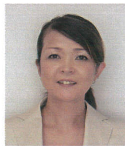
インテリアデザイナーの職員です