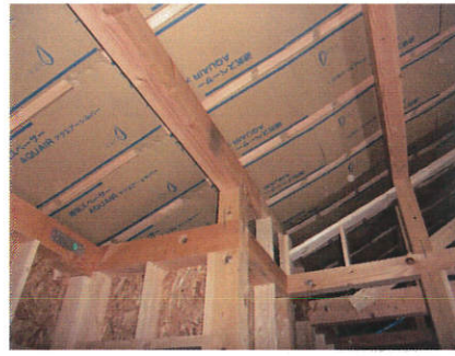
耐震・制震・節電(高気密・高断熱)と大収納のロフトも備えた二世帯住宅です。