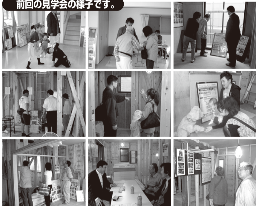
前回の見学会の様子です。