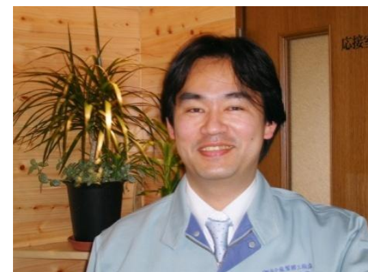
子育て世代の建築士