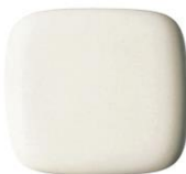
#SC1 パステルアイボリー